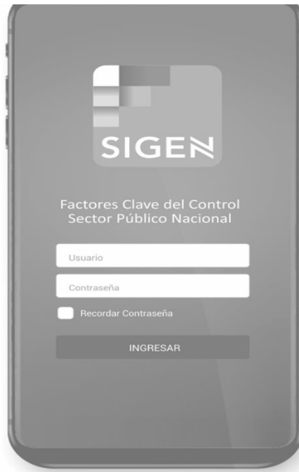
Gráfico 1 – Pantalla de identificación de usuario