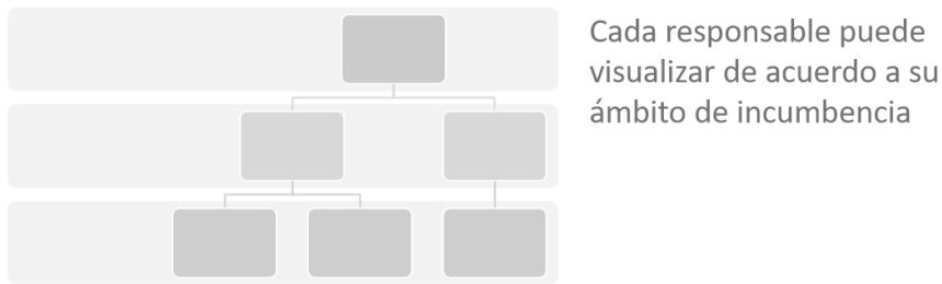
Gráfico 2 – Esquema permisos de visualización por ámbito de incumbencia