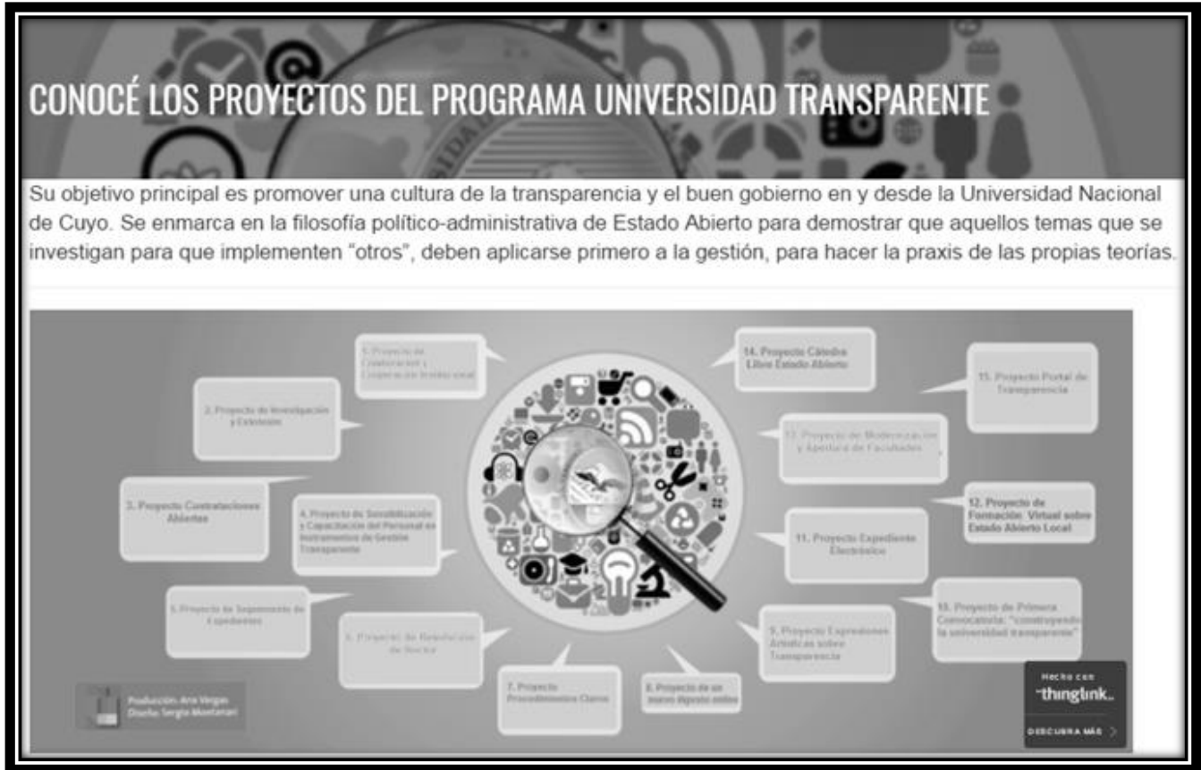
Gráfico N° 2: Proyectos del Programa de Gobierno Abierto Universidad Transparente.